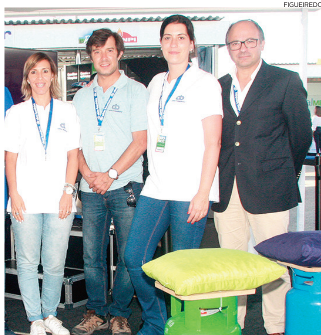
Grupo tem várias novidades no stand, incluindo um simulador

Claro que sim. A nossa aposta em patrocinar o dia da actuação do cantor Tony Carreira muito se aproxima com a nossa imagem – proximidade, humildade e aposta numa diversidade de públicos a todos os níveis. Quem melhor do que o Tony Carreira, cantor português para transmitir todos estes valores que pretendemos? Além disso, a nossa aposta consistiu em diferentes acções de marketing no campo que proporcionou momentos de lazer a crianças, jovens e adultos. A Academia de Retalho (unidade móvel que facilita a formação “in loco” nos nossos postos de abastecimento), presente no campo de jogos proporcionou diversas actividades às crianças. As ideias concebidas a pensar neste dia foram um tremendo sucesso nomeadamente os cartazes que azularam todo o recinto e levaram o nome da Alves Bandeira a todos. O Domingo é também um dia especial porque pretendemos abraçar não só aqueles que se encontram em período