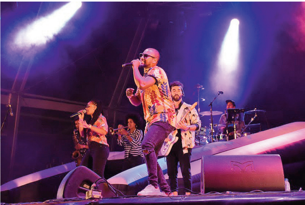
HMB encerraram com uma grande “performance” a noite de segunda-feira

RECORDE Milhares de jovens afluíram ao recinto para ver o rapper português e a banda nacional de soul e funk