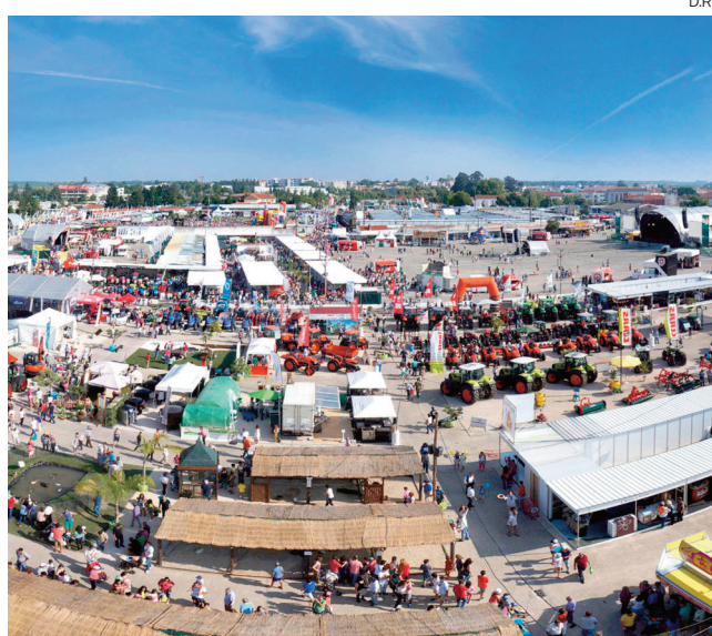
Certame mantém preço dos stans e espaço disponível

«Este procedimento habitual é obrigatório para a admissão de novos expositores, mesmo para as empresas que, eventualmente, já tenham estado em lista de espera em anos anteriores. A selecção será feita de entre os candidatos