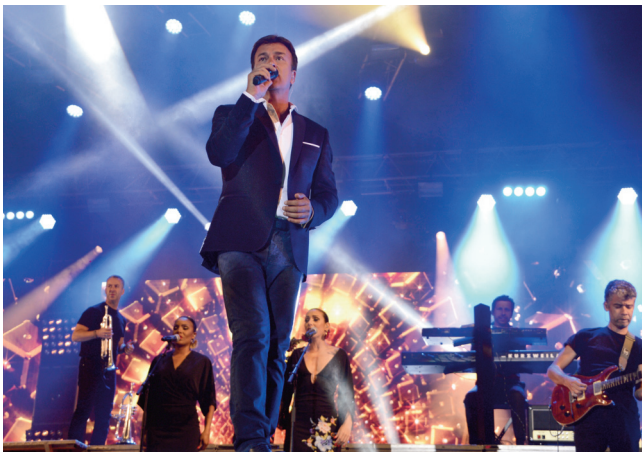
Tony Carreira “arrastou” legião de fãs a Cantanhede