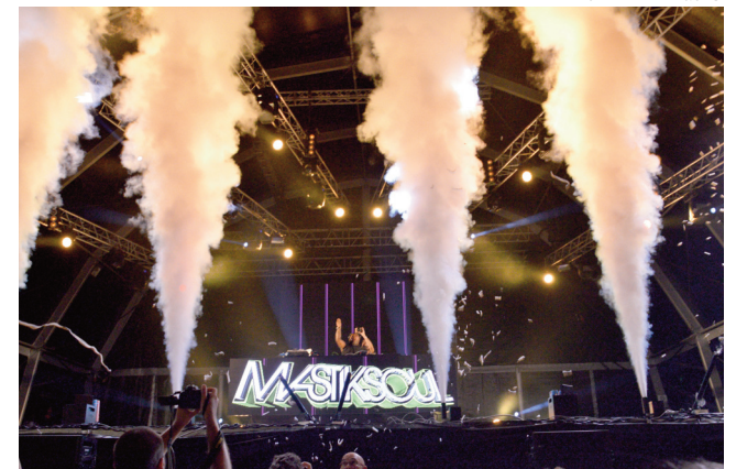
Mastiksoul colocou público a vibrar com os seus sons

ESPECTÁCULOS James Arthur foi a grande atracção da penúltima noite da Expofacil. A actuação do britânico foi “brindada” com a presença de uma legião de fãs que encheu por completo o recinto do palco principal do certame.