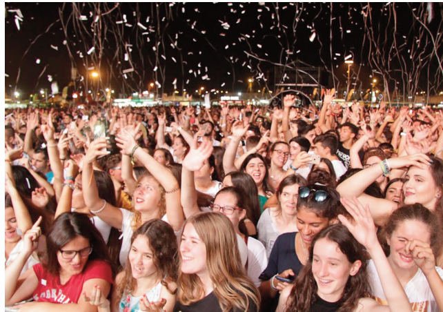
Público compareceu sempre em grande número